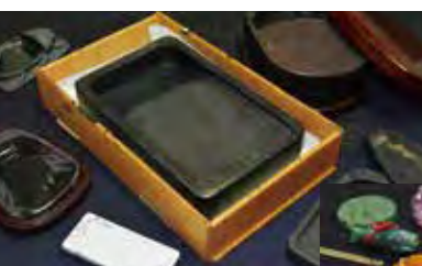
▲▶近所の方から譲り受けたものや、プレゼントに頂いたもの、賞を受賞した際の記念品なども。

簡単そうに見えて意外と難しく、のりしろを可能な限り短く・曲がらないように重ねる・のりが乾かないうちに貼り合わせるなど、いかに美しく継ぐか、集中力・スピード・正確性が求められます。